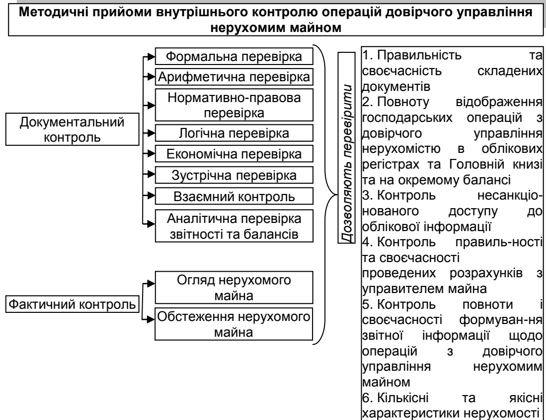
Рис. 2. Методичні прийоми контролю операцій довірчого управління нерухомим майном

Під час перевірки операцій з нерухомим майном в довірчому управлінні необхідно перевірити наявність договорів про довірче управління нерухомим майном, порядок передачі та повернення майна з довірчого управління. Відповідно за наявності договору необхідно перевірити: